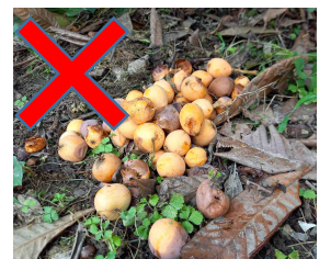
果実の野積み状態の放置