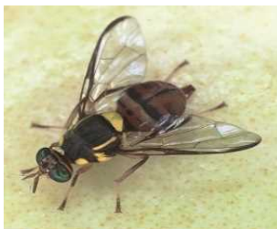
← ミカンコミバエ成虫

寄生する植物:かんきつ類、びわ、ぶどう、もも、なし、かき、いちじく、オリーブ、すもも、マンゴー、パパイヤ、パッションフルーツ、ドラゴンフルーツ、いちご、カボチャ、キュウリ、スイカ、ニガウリ、トマト、ナス、シシトウガラシ、ピーマン、パプリカ等