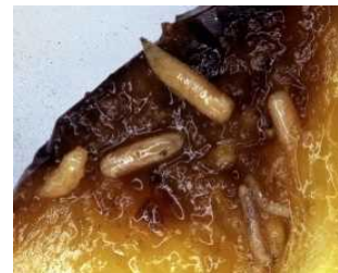
幼虫による果実の食害 →