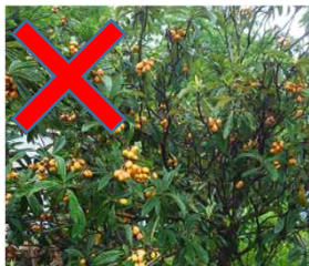
出荷や自家消費しない 不用果実の放置

・対象地域:長崎市、佐世保市、諫早市、大村市、対馬市、西海市、時津町、長与町、新上五島町