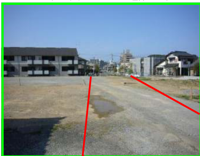
西彼杵郵便局側から延長予定の西時津左底線