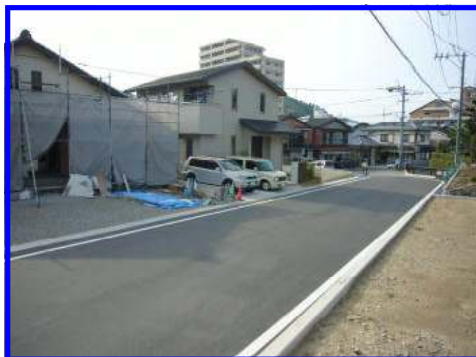
幅員8メートル区画道路（8-1号線）