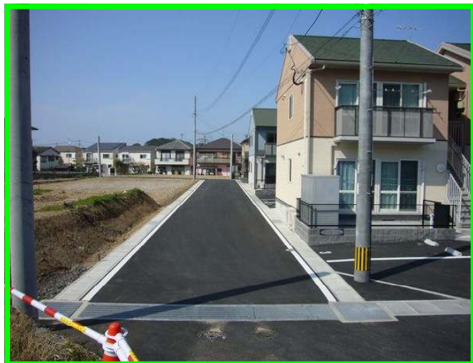
幅員6メートルの区画道路