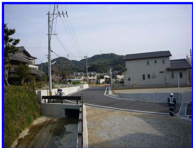
水路は道路の下を流れています