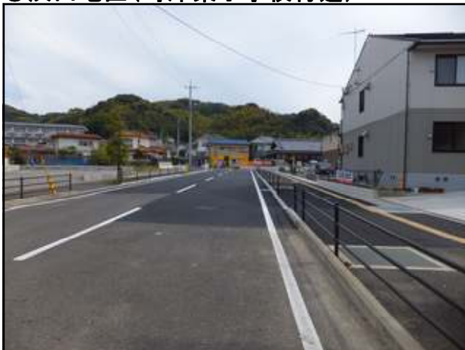
都市計画道路西時津左底線