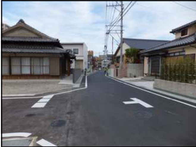
拡幅された町道茶屋の本線