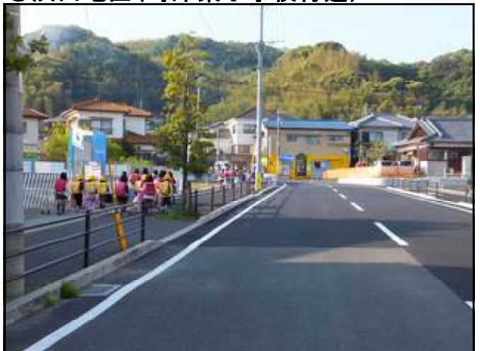
歩道を通学する児童のみなさん