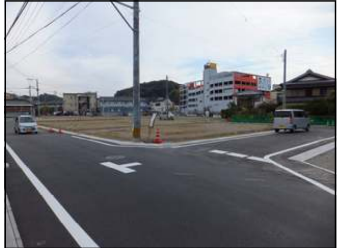
造成された3街区、4街区