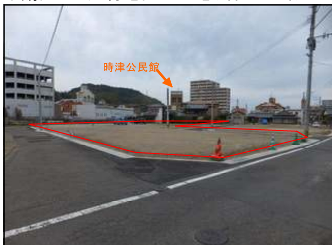
○購入した元村地区の土地(4街区の一部)