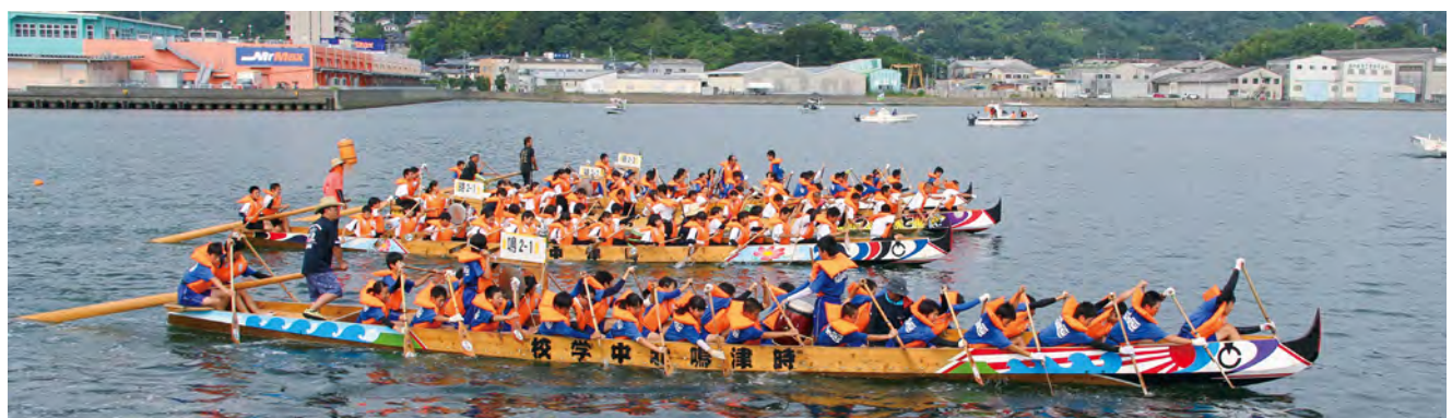
第33回 時津町中学生ペーロン大会