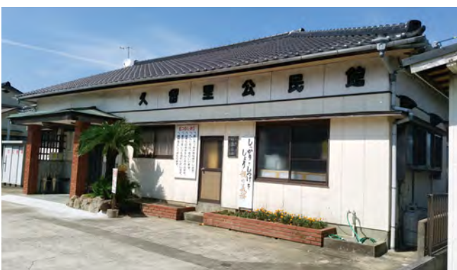
現在の久留里公民館