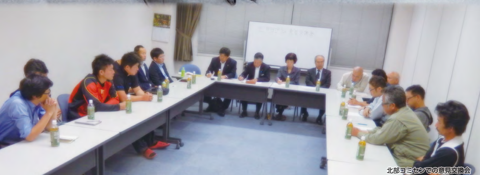
北部コミセンでの意見交換会