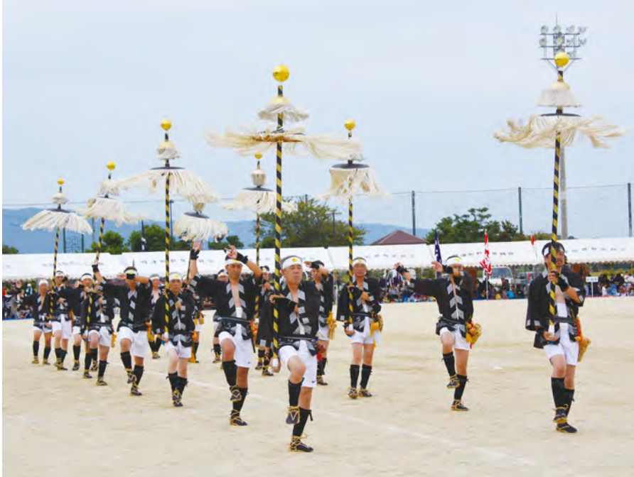
昨年の町民体育祭で披露された「浜田浮立」

A 地域の状況に合った競技を考えるべきと思う。日頃から地域の活動が参加者を集める事につながると思う。