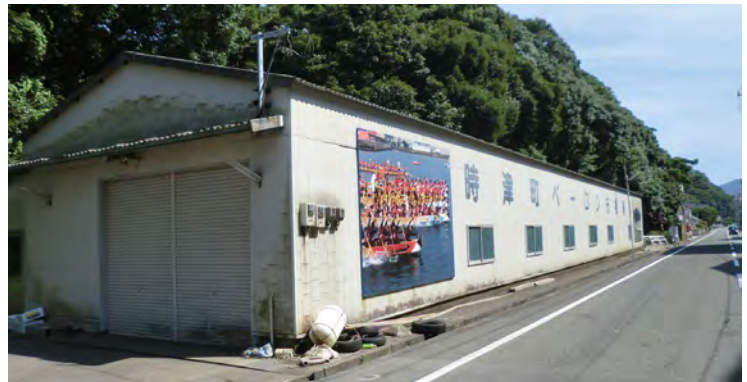
現在のペーロン船格納庫

A ペーロン協会と公民館連絡協議会で、この案件については話し合いをしているとお聞きしている。ペーロン協会と公民館連絡協議会に働きかける。