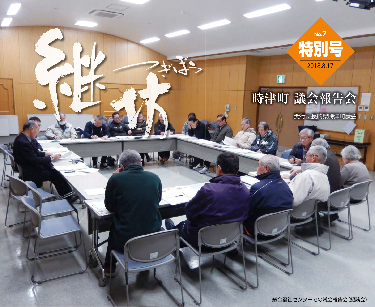
総合福祉センターでの議会報告会(懇談会)