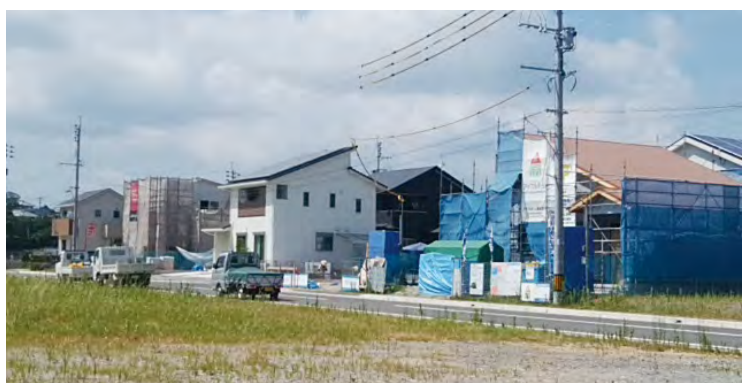
建設中の十工区 新興住宅地

A 現在、シーサイドⅡ団地には2名の児童がいるが見守り隊の方が付いていて、学校付近や通学路の児童と合流するところまで送って頂いている。6月には児童数が4名増えるが、その仕組みは変えずに見守り隊をお願いするとしている。しかし今後住宅は増える状況なので、それ以降