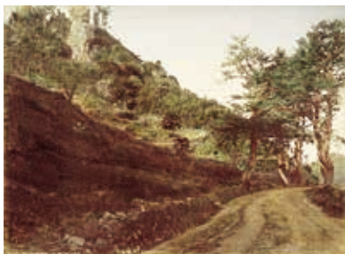
時津街道・鯖くさらかし岩(明治中期)