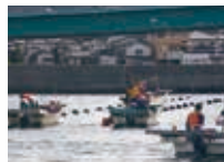
稚ナマコの中間育成