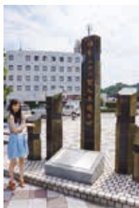
①日本二十六聖人上陸記念碑《浦郷》