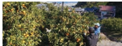
たわわに実ったみかん