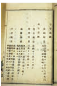
明治政府が定めた街道(道路)を示す文書(明治8年)／長崎歴史文化博物館所蔵