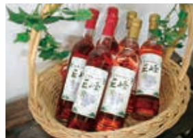
とぎつワイン巨峰