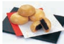
とぎつまんじゅう