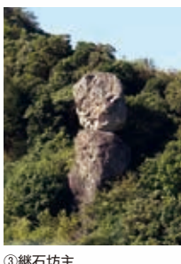
③継石坊主(鯖くさらかし岩)《元村郷》