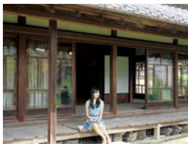
②お茶屋(本陣)跡《元村郷》