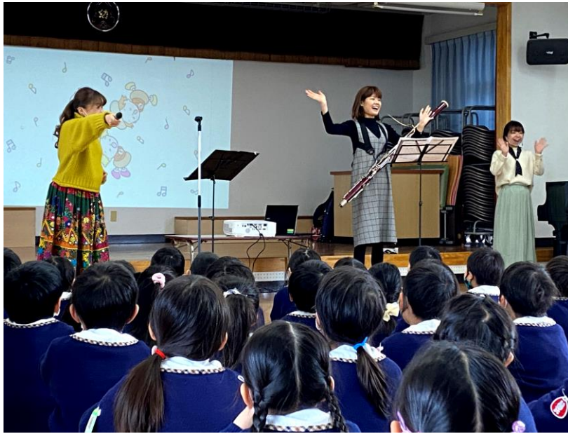
(Present 4U Project 幼稚園)