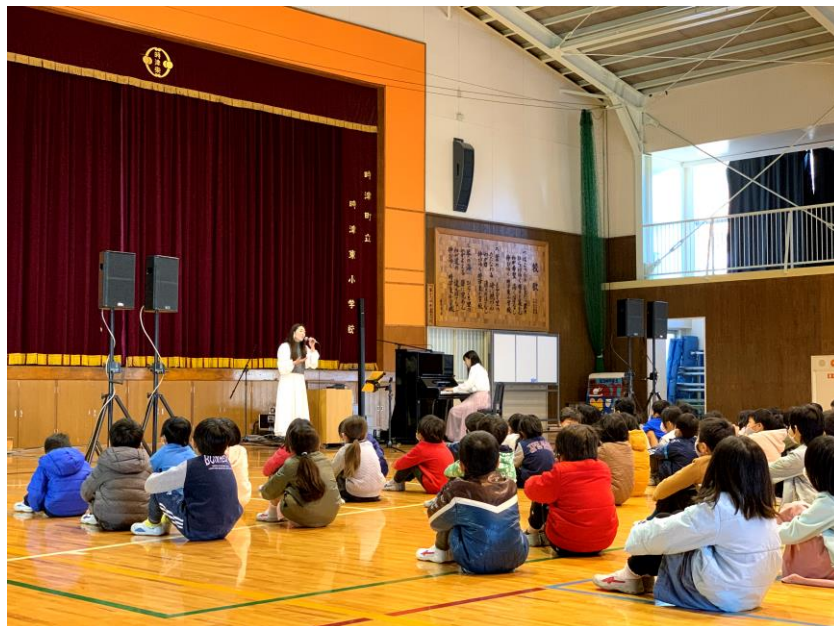
(Present 4U Project 小学校低学年)