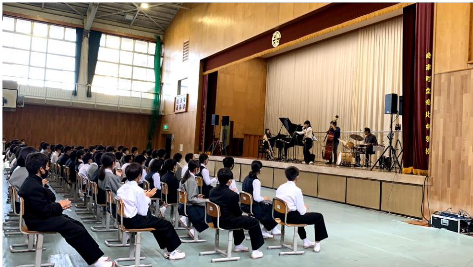
(Present 4U Project 中学校)