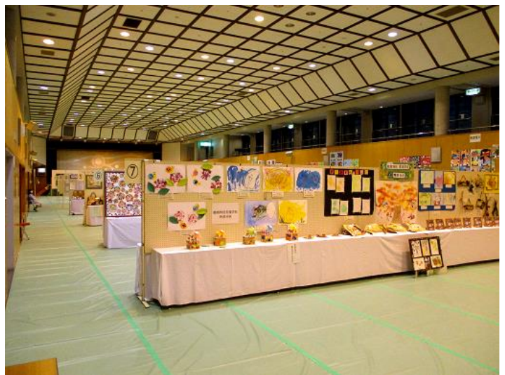
【「時津町文化祭・作品展」(2階作品展示会場)】