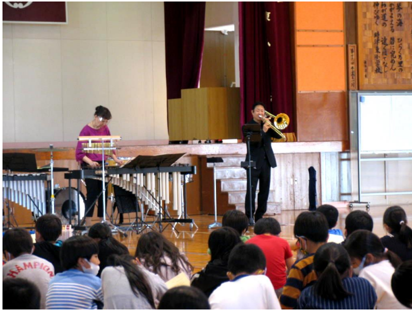
(Present 4U Project 小学校高学年)