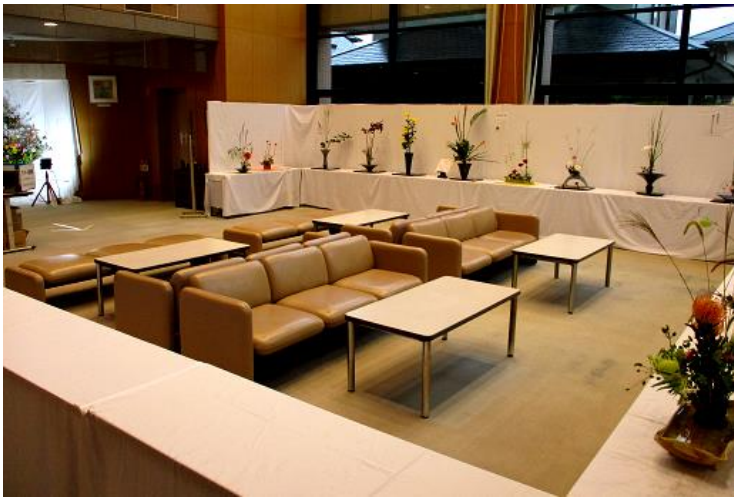
【「時津町文化祭・作品展」(1階生け花展示会場)】