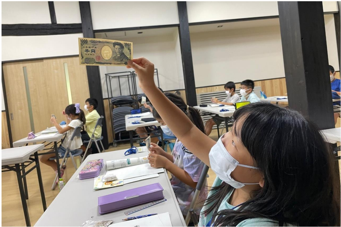
【「楽しく学ぼう！お金のはなし教室」（時津公民館 夏休みチャレンジ子ども教室）】