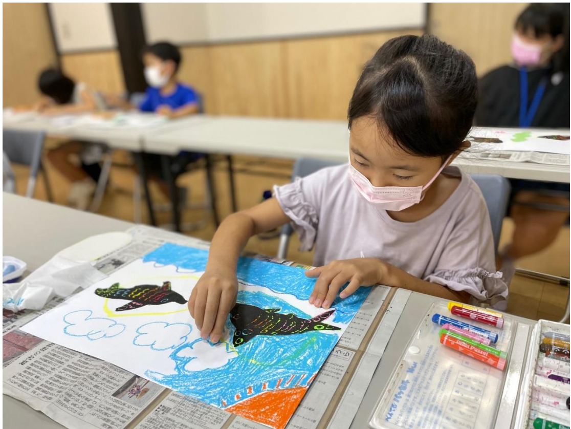
【「子どもスクラッチ教室」（時津公民館 夏休みチャレンジ子ども教室）】