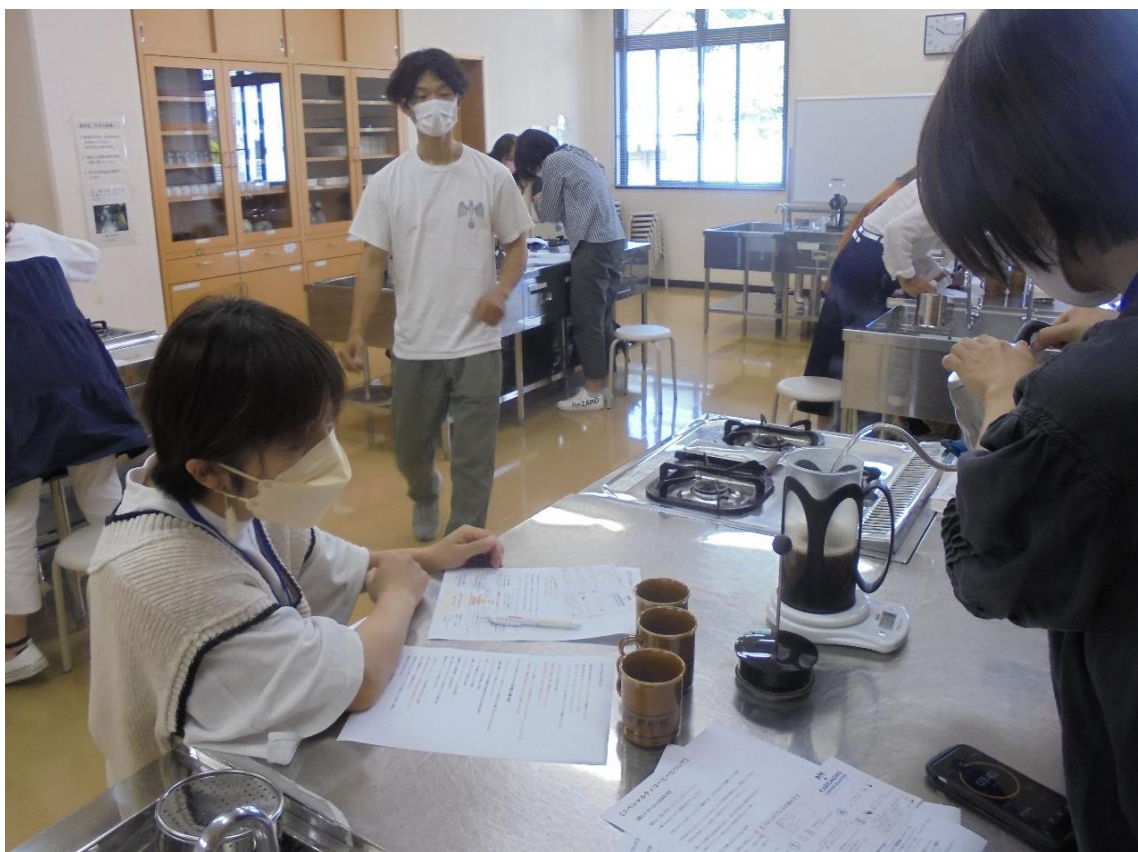
【「コーヒー講座」（北部コミュニティセンター 前期講座）】