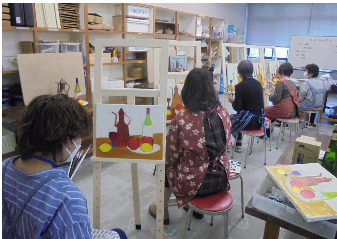
【「油絵手ほどき教室」（北部コミュニティセンター 後期講座）】