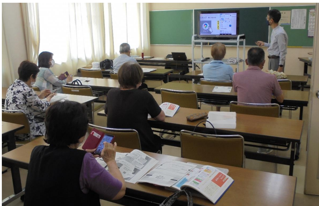
【「スマホ携帯わくわく講座」（コスモス会館・東部コミセン 前期講座）】