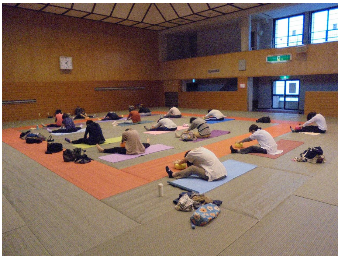
【「健康運動教室」（コスモス会館・東部コミセン 後期講座）】