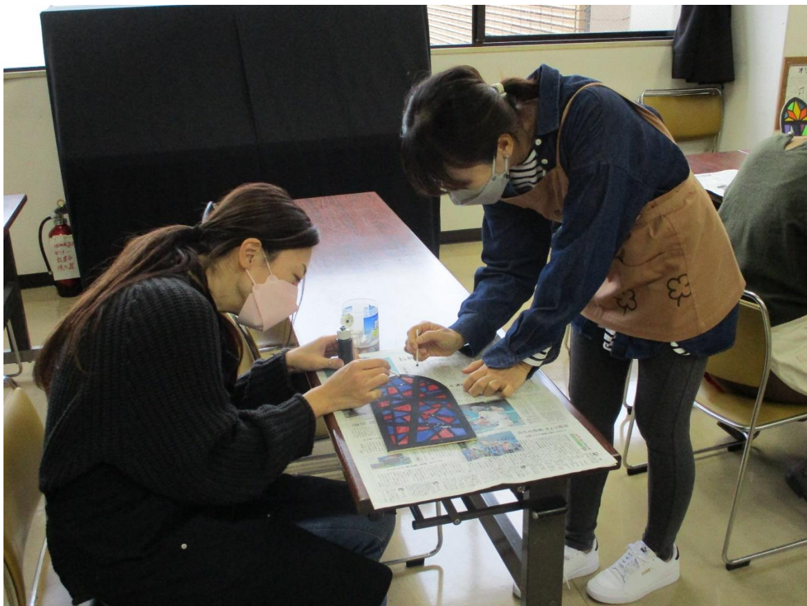
【「チョークアート教室」（時津公民館 後期講座）】