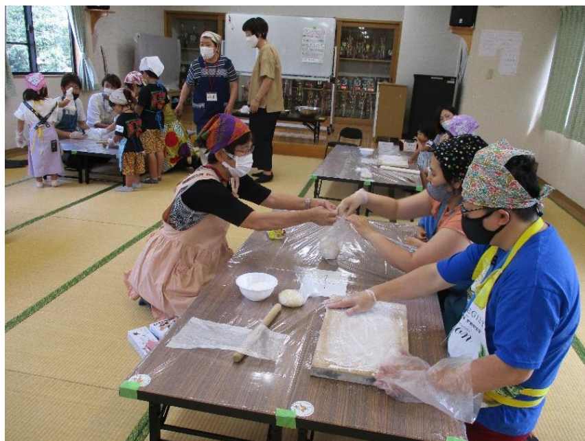
【エンジョイパパママ in 左底】