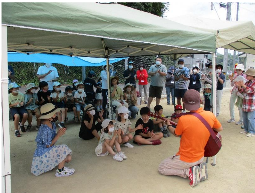
【エンジョイパパママ in 元村】