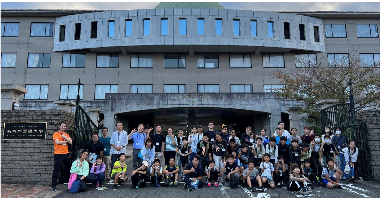
【時津町子ども育成会連絡協議会主催 ジュニアリーダー研修】