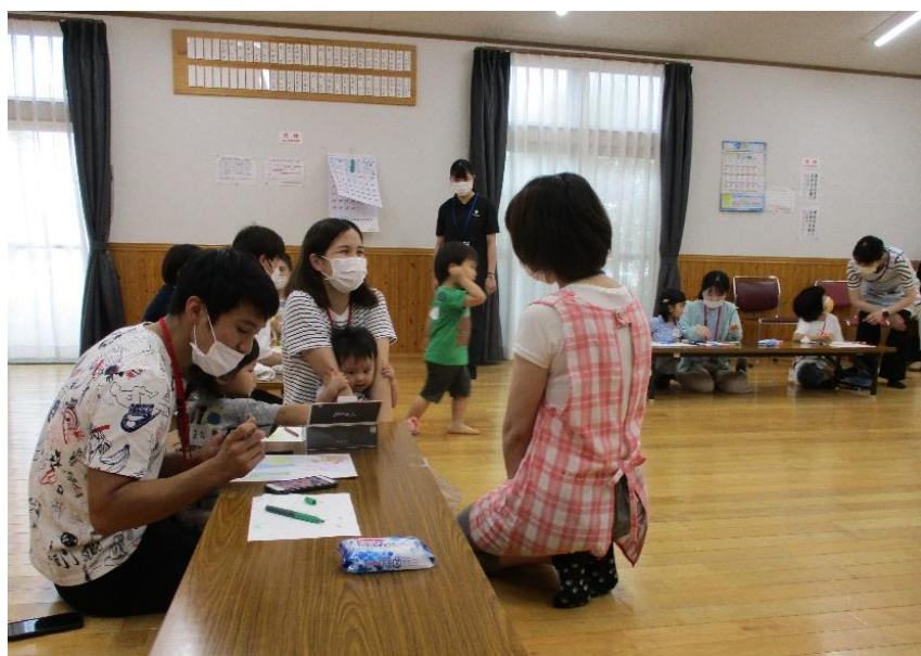
【エンジョイパパママ in 野田】